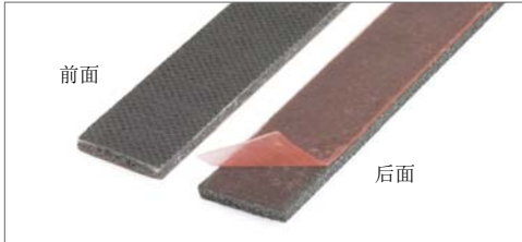
也可提供：IFPS防火密封条，900 x 17 x 2.7 mm，自粘型 订货号 99303